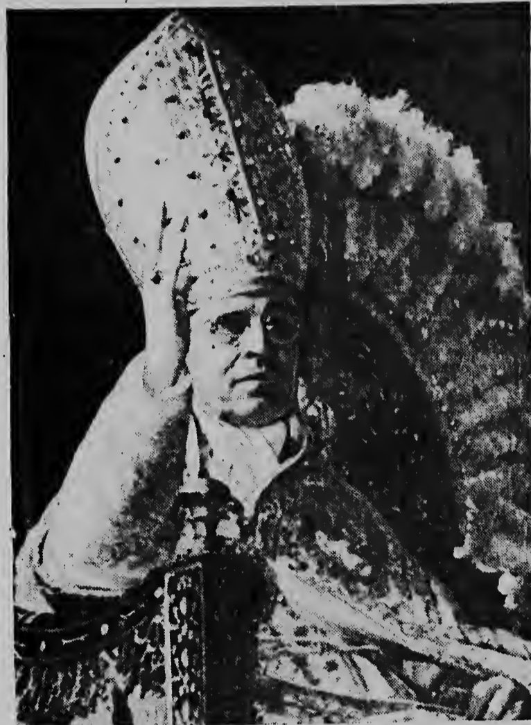
KERSTBOODSCHAP..... Zijne Heiligheid de Paus zal Vrijdag om 06.30 uur Ant tijd een kerstboodschap tot de r.k. wereld richten. Op de eerste kerstdag zal hij voor zijn venster verschijnen om de personen op het Sint Pietersplein te zegenen.